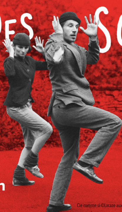
Cie comme si

22 > 24 juillet Salies-de-Béarn 13 e édition